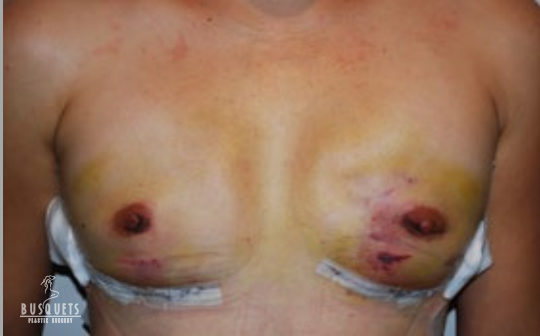
RECONSTRUCCIÓN POR EXPANSORES